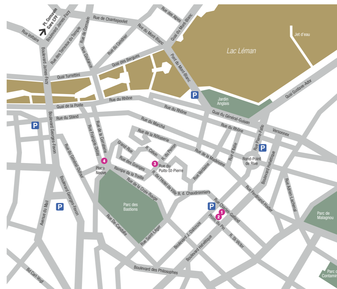
Plan reproduit avec l'autorisation du cadastre de Genève 09.09.02

L'Horlogerie à Genève Magie des métiers, trésors d'or et d'émail 15 décembre 2011 - 29 avril 2012 Inauguration le 14 décembre Entrée CHF 10.-/5.-