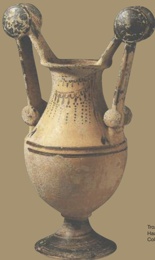
Trozzella, Messapie, IV e s. av. J.-C. Haut. 32 cm. Coll. Hellas et Roma