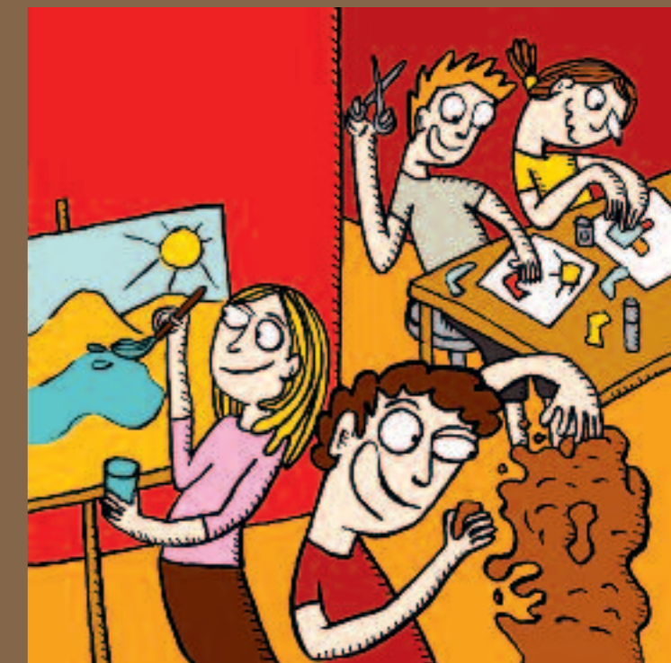
Illustration Adrienne Barman