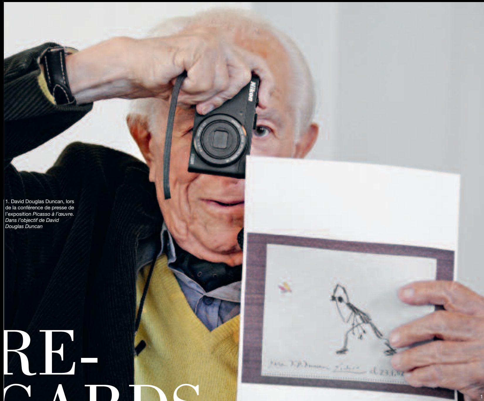
1. David Douglas Duncan, lors de la conférence de presse de l'exposition Picasso à l'œuvre . Dans l'objectif de David Douglas Duncan