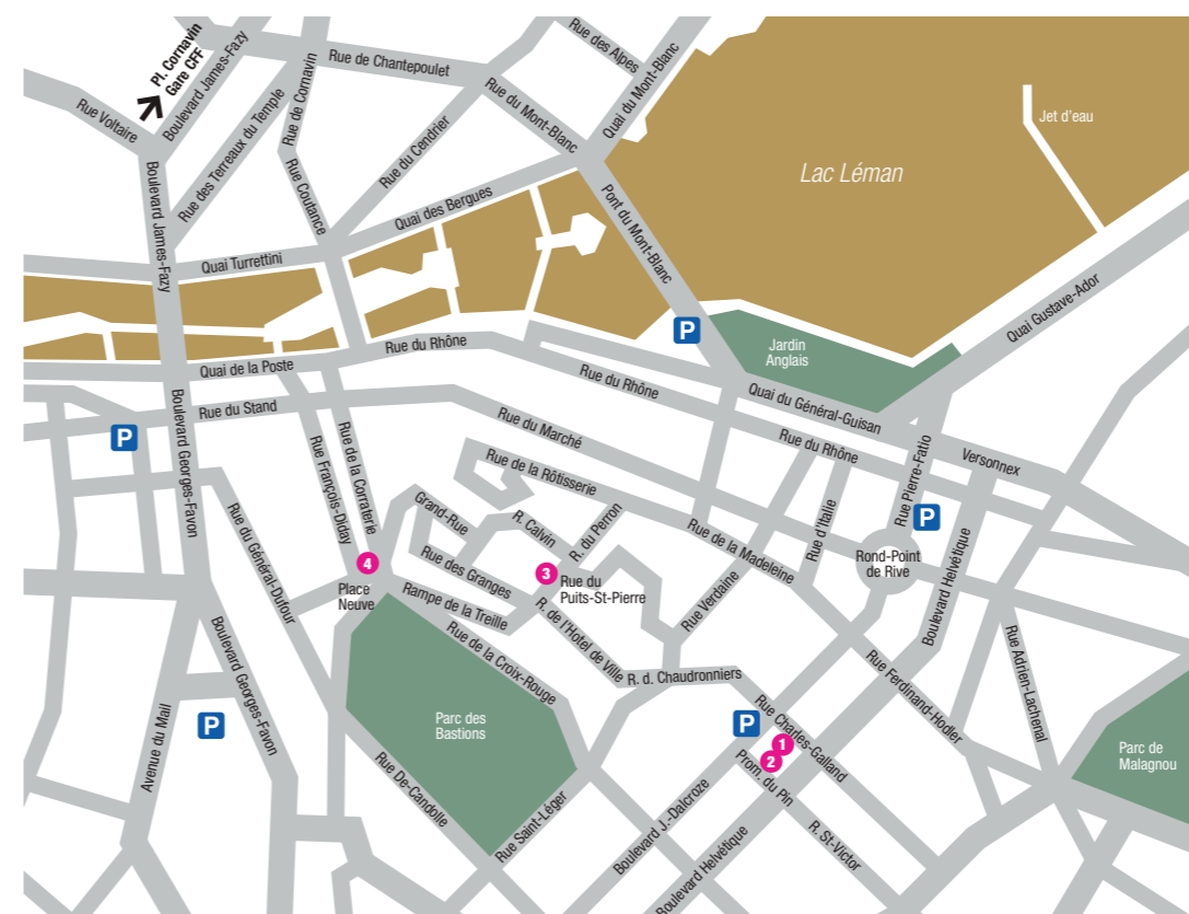
Plan reproduit avec l'autorisation du cadastre de Genève 09.09.02