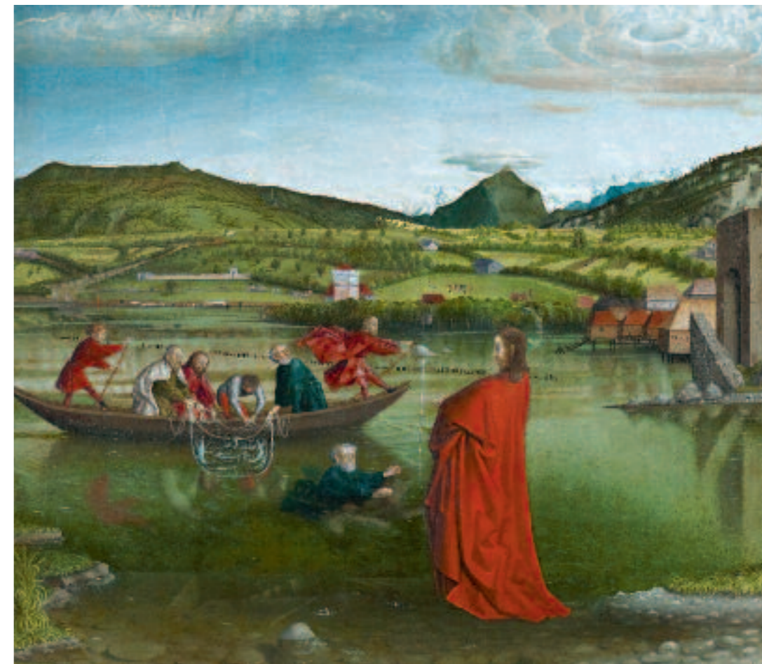
Konrad Witz, La Pêche miraculeuse , 1444, après restauration en 2012

Un colloque coproduit par l'Institut de hautes études internationales et du développement et le MAH