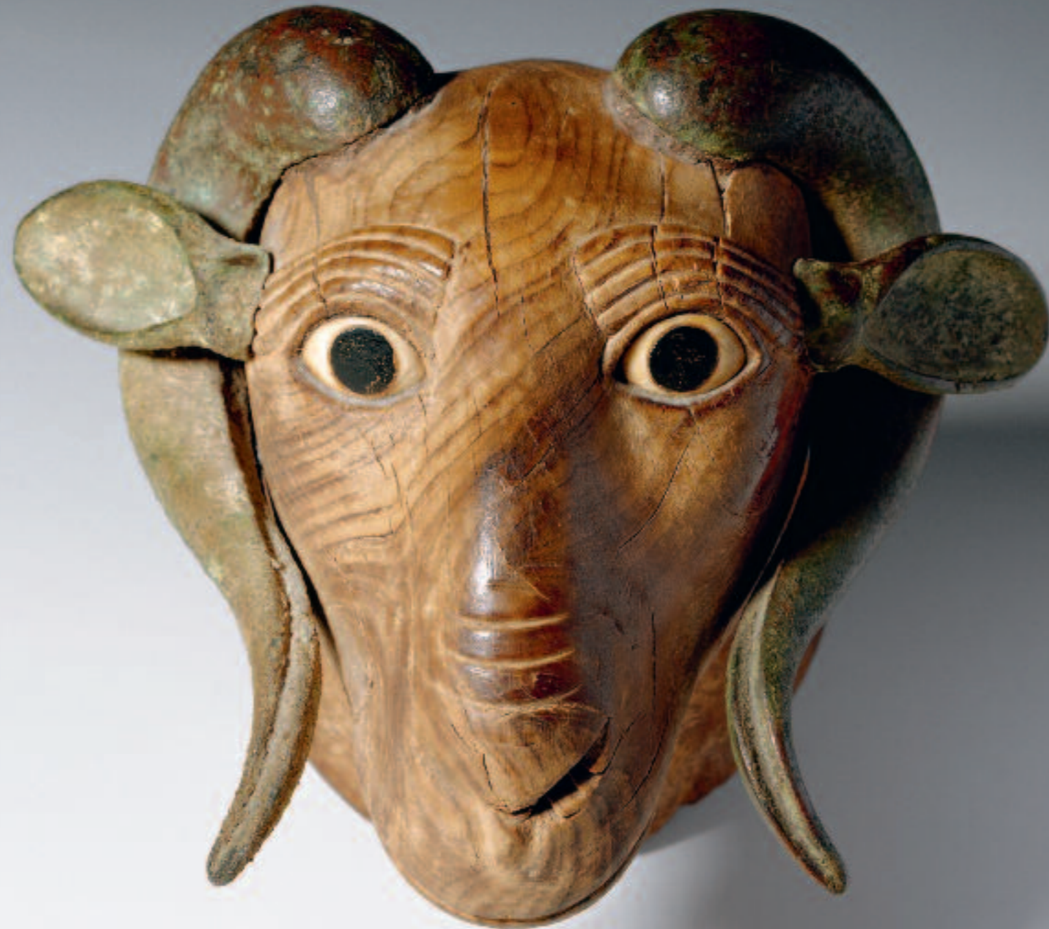
Tête de bélier, Égypte, Basse époque, XXV e -XXVI e dynasties, bois, bronze, incrustations de pierre, long. 19,5 cm, ancienne collection Dr Joseph Malartre, Fondation Gandur pour l'Art

Cet objet exceptionnel de la Fondation Gandur pour l'Art sera un jour exposé dans le futur Musée d'art et d'histoire rénové et agrandi.