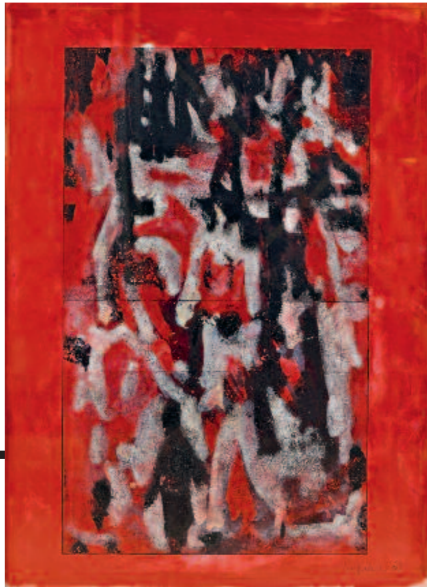
Roger Pfund, Foule, 2005 113 x 83 cm Technique mixte

Figurine féminine, Byblos, « temple aux obélisques », Âge du Bronze moyen, Bronze, H. 7,9 cm ; L. 1,7 cm. Figurine masculine, Byblos, « temple aux obélisques », Âge du Bronze moyen, Bronze, H. 18 cm ; L. 3,8 cm