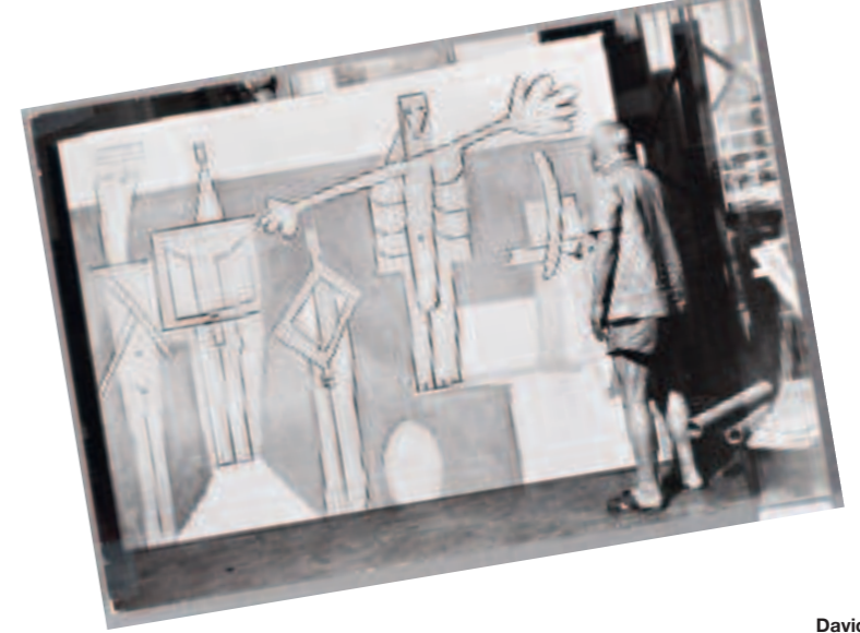
David Douglas Duncan, Pablo Picasso peignant les tracés noirs des personnages de Baigneurs à la Garoupe , Cannes, villa La Californie, juillet 1957